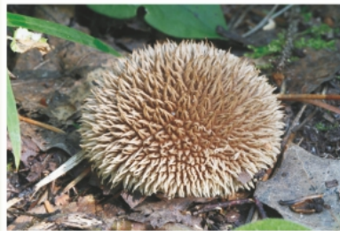
Дождевик ежевиноколючий ( Lycoperdon echinatum )