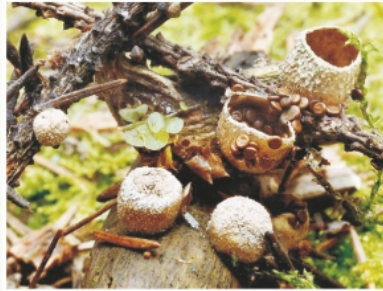
Гнездовка, или нидулярия ( Nidularia )