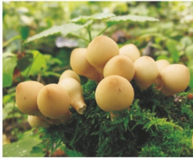
Дождевик грушевидный ( Lycoperdon pyriforme )

Среди дождевиков много видов, имеющих своеобразную форму плодового тела. Так, гнездо птицы с яичками напоминает плодовое тело Нидулярии. Округлое, крупное плодовое тело головача напоминает футбольный мяч, с лучами. Как у звезды — плодовое тело у земляных звездочек, в