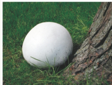
Дождевик гигантский Langermannia gigantea ( Calvatia gigantea )