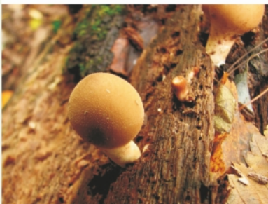
Дождевик шиповатый, или жемчужный ( Lycoperdon perlatum )

форме груши — у грушевидного дождевика. Заячьей картошкой называют некоторые округлой формы дождевики. Нередко на лугах, полях, выгонах, в садах, парках и лесах растет дождевик-фляжка, получивший свое прозвище за сужающееся книзу продолговатое плодовое тело. В поисках белых грибов грибники часто обходят стороной эти съедобные грибы. Не случайно А. Черемнов упоминает о них в строках своего стихотворения: