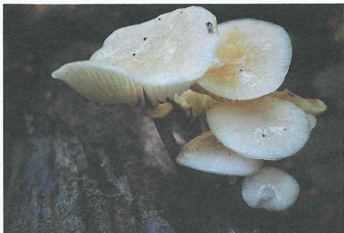
Удемансиелла слизистая ( Oudemansiella mucida )

Из удемансиеллы слизистой получен антибиотик муцидин, который в виде препарата муцидермина используется при различных грибковых заболеваниях человека. Наиболее активными в продуцировании антибиотиков оказались лисичка настоящая и груздь синеющий.