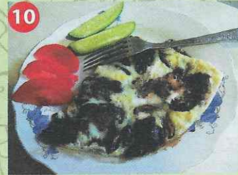
10 Готовое блюдо: внешний вид - не самое главное!

19320 Газету «Грибная аптека» в Республике Беларусь можно приобрести в ООО «Арго-НН» 220030, г. Минск, ул. К. Маркса, 15, офис 313, тел.: 206-68-46 Подписка в Белоруссии – каталог РУП «Белпочта» 19320