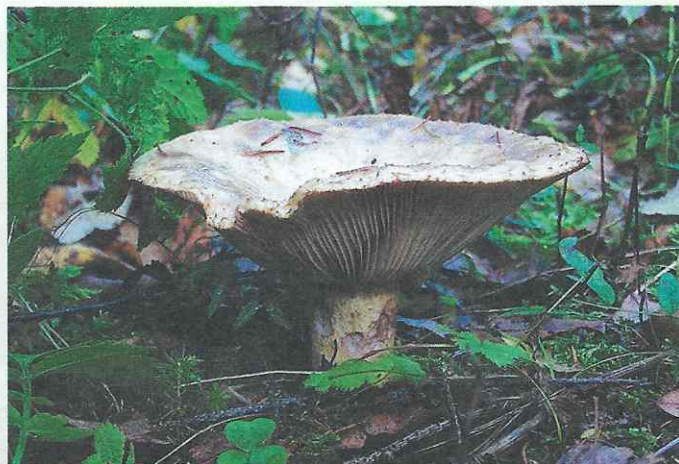
Груздь синеющий ( Lactarius repraesentaneus )

Чайный гриб, известный под названиями «маньчжурского», «японского» и «морского» – Medusomyces gicevii . Тело этого гриба представляет собой не только мицелий самого гриба, но и скопление, зооглею уксуснокислой бактерии – Bacterium xylinum .