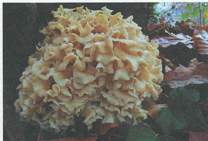
Грибная капуста ( Sparassis crispa )

В начале двадцать первого века целая плеяда выдающихся микологов заинтересовалась лечебными свойствами грибов и опубликование научных трудов уже тянет на добрую сотню томов.