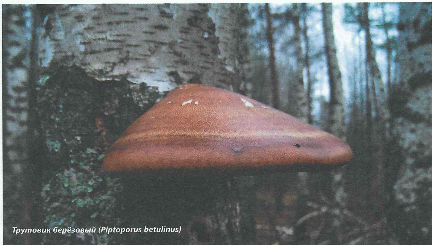
Трутовик берёзовый ( Piptoporus betulinus )