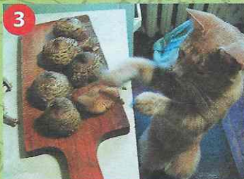
3 Какие штуки! Дай поиграть!