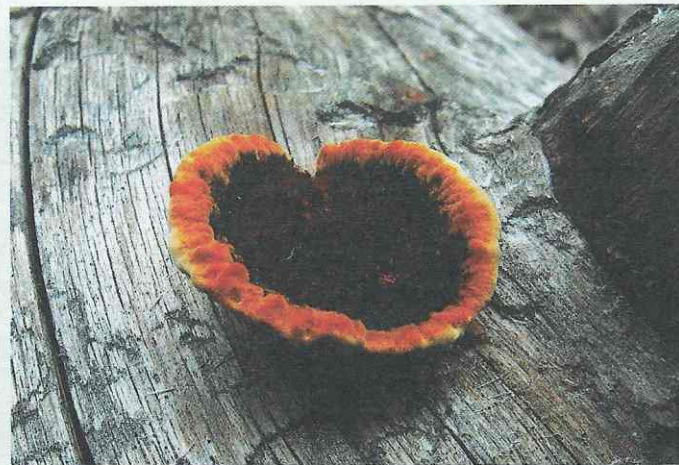
Заборный гриб ( Gloeophyllum sepiarium )