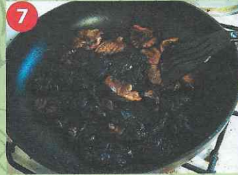
7 Какой ужас! Грибы почернели и «обуглились»