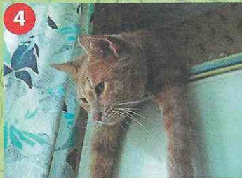
4 Как я устал, если б вы знали...