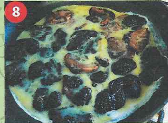
8 Заливаем «угольки» яичной болтушкой