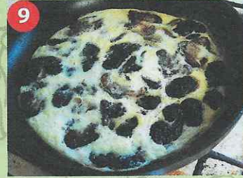
9 А получилось не так уж плохо...