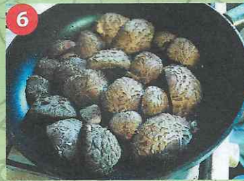
6 Живописная композиция на сковороде