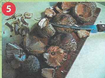
5 Режем грибы и удаляем несъедобные части

Поскольку мы с Вами пишем рецепт грибного блюда, то начать мы должны со слова «ингредиенты». Однако кот в приготовлении этого блюда принимает самое непосредственное участие, кроме того, готовить его мы не собираемся. Поэтому начнём со слова «участники».