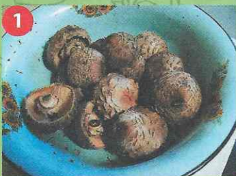
1 Один из участников – гриб-зонтик краснеющий