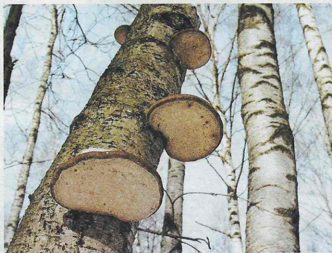
Березовая губка – пиптопорус березовый ( Piptoporus betulinus )

Чагу и березовый лепех кусочками (200 г) залить горячим медом (1 стакан меда развести 1 стаканом воды и довести до кипения), настоять в теплом месте два дня. Затем профильтровать через сито и марлю и развести в 3-х литрах березового сока, добавить сухие дикие груши (можно яблоки или изюм). Накрыть материей и поставить на три дня – бродить. Затем перелить в стеклянные бутылки или банки под крышку. И убрать в холодное место. Хранится не более четырех месяцев. Вкус отменный. Здоровье несомненное.