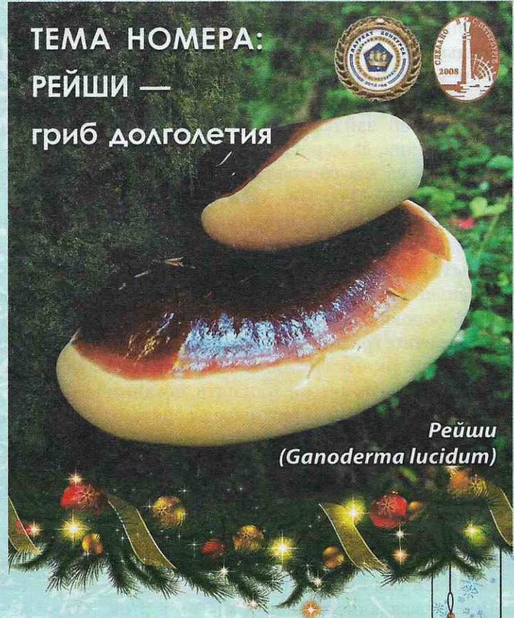
Рейши ( Ganoderma lucidum )