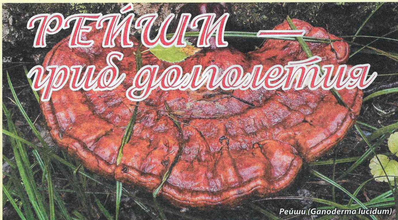
Рейши ( Ganoderma lucidum )

Рейши – древесный гриб – в Китае называется грибом долголетия. Это символ Китая. Изображение рейши в Китае так же популярны, как у нас мухомора. Найти рейши в дикой природе всегда считалось большой удачей. Дело в том, что шероховатые, жесткие споры этого гриба хотя и цепляются к коре любых деревьев, прорасти могут только при определенной температуре и лишь на определенном дереве. А любят они дикую сливу, причем не каждую. Как утверждает знаменитый врач древности Ибн Сина, из десяти тысяч диких слив только десяток может похвастаться своими соседями-приживалами – древесными грибами рейши.